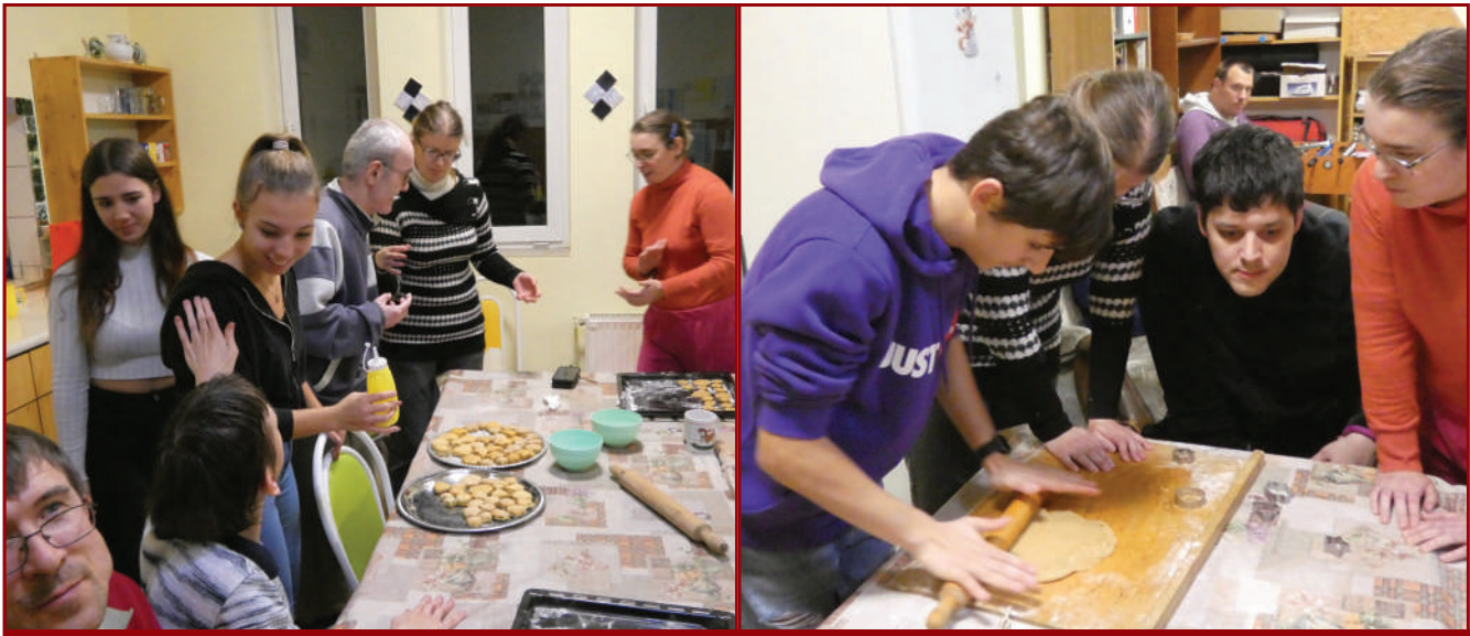
Közös adventi készülődés