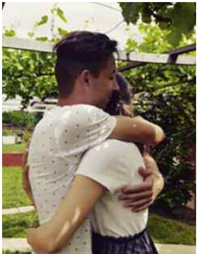
A barátom ölelései biztosságot nyújtottak