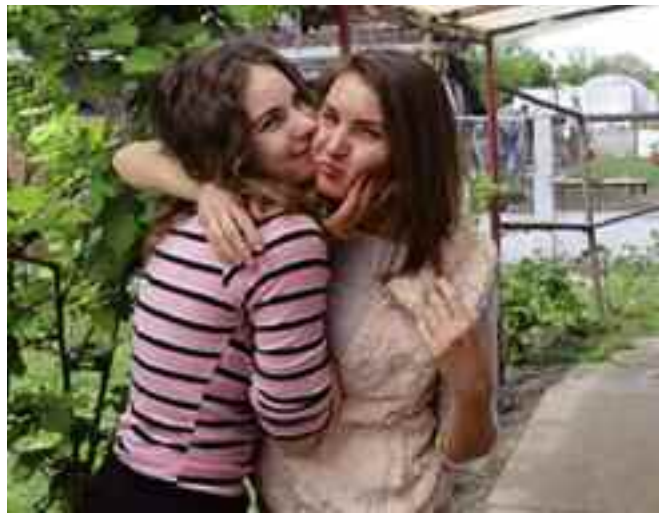
Nővérem szavai egyenlők a bizalommal

Vigyázni, szeretni, védeni talán ez a legfontosabb életünk során és persze, hogy a maszkot ne felejtjük el.