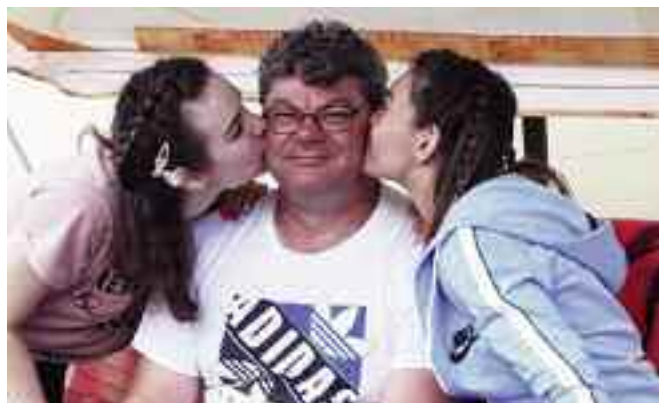
Apukám érintése nyugalmat árasztott felém